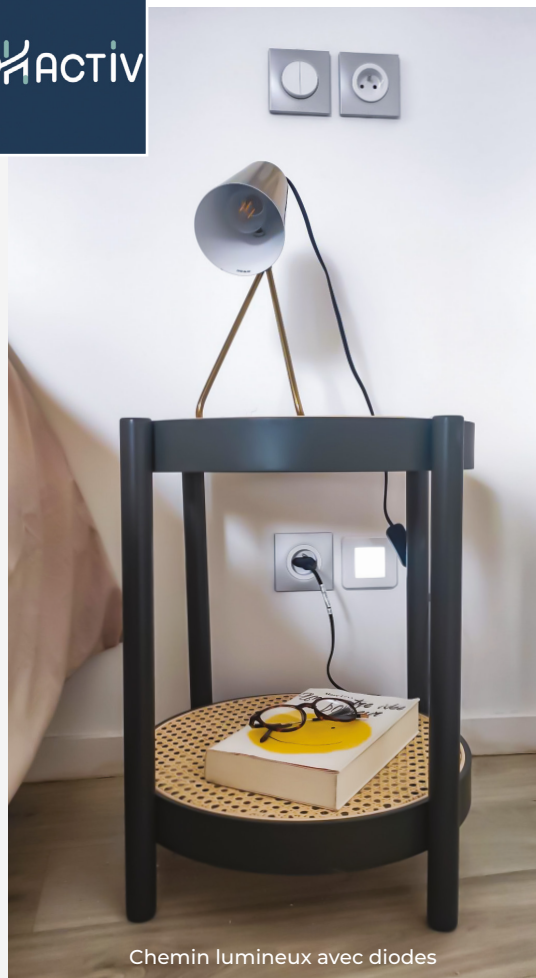
Chemin lumineux avec diodes